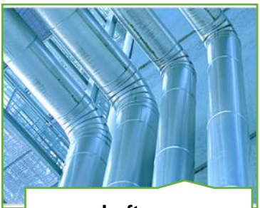
Luft- og ventilationsteknologi