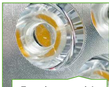
Energi og materiale effektivitet