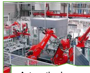
Automatisering og kontrolteknologi