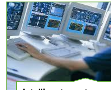
Intelligente systemer og Grøn ICT