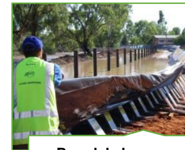
Beredskabs- og sikkerhedsteknologi