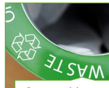
Genanvendelse og affaldshåndtering