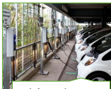
Infrastruktur og forsyningsnetværk